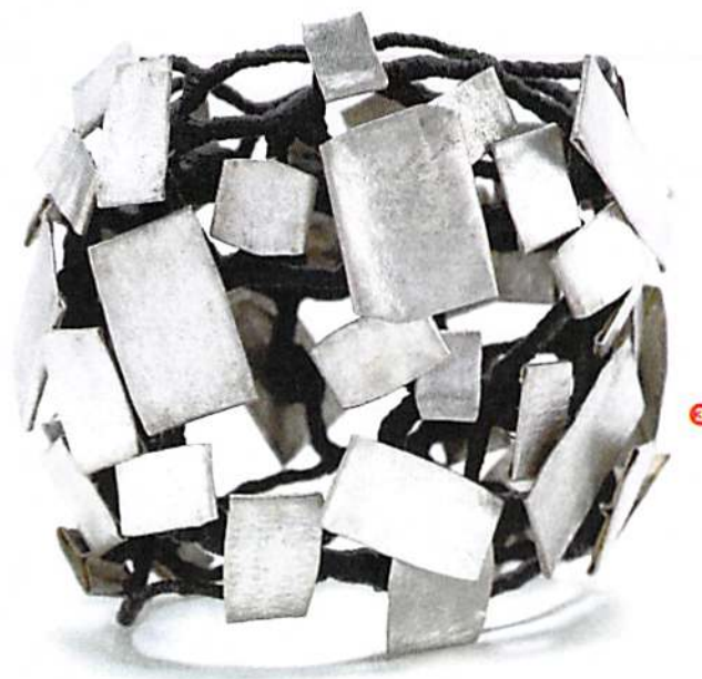
3 Sonia Morel Bracelet , 2010 Argent et fil polyester