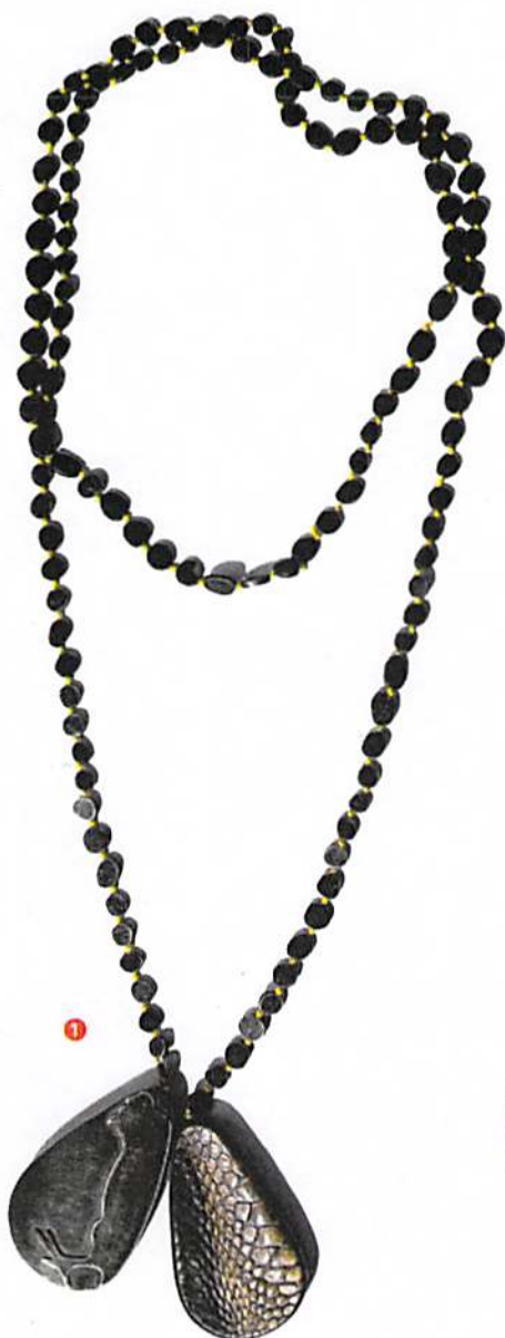
1 Louise Vurpas Collier , 2009 Argent et peau de poulet