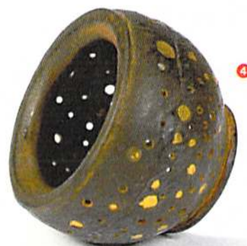
4 Esther Brinkmann Bague boule , 2004 Fer et or